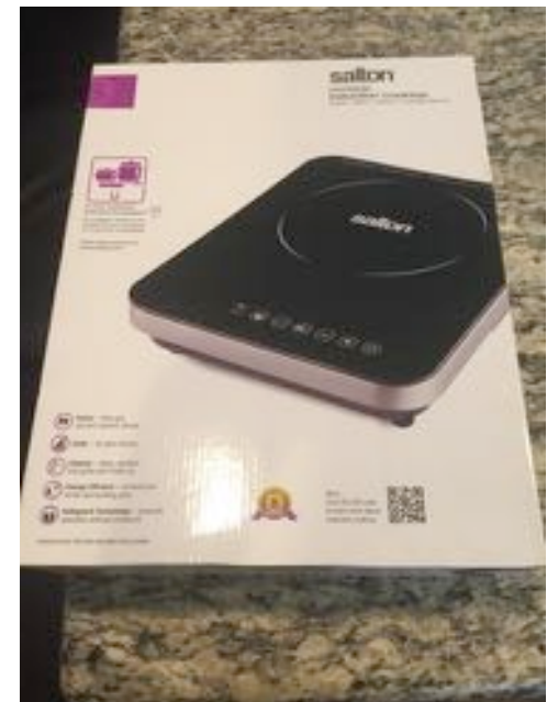
Plaque induction 25$